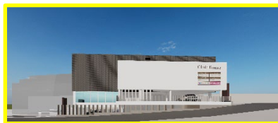
Ⓑ 現在建築中(令和7年春オープン)の (仮称) 覚王山医療モール 令和5年10月16日プレスリリース済