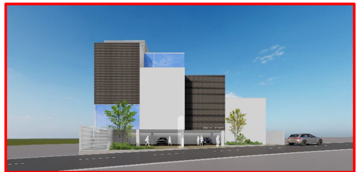
Ⓐ (仮称) 覚王山医療モール(第二計画) 東側外観イメージ