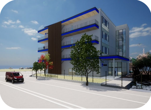
※新事務棟の完成イメージ

金属不純物管理技術向上およびヨウ素化合物を中心とした半導体関連製品（フォトレジスト材料向け化合物等）の受託開発拡大に対応。本件 金属管理技術関連設備の取得は、グループ中期計画中の既存事業・新製品開発への成長投資 に該当するものです。